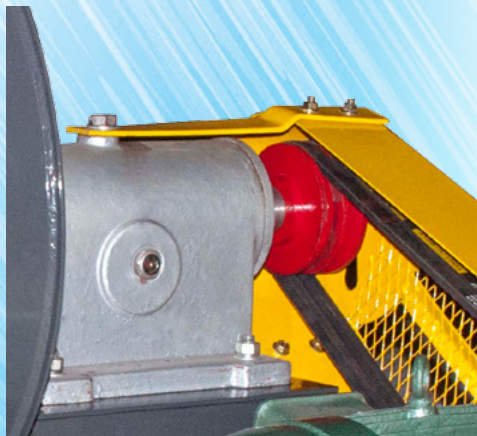
Gối đỡ dạng kín, bôi trơn bằng dầu làm mát nước